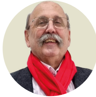
Jean-Pierre CERBAI Maire d'Algrange